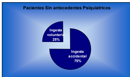
Tabla nº 4