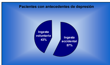
Tabla nº 3